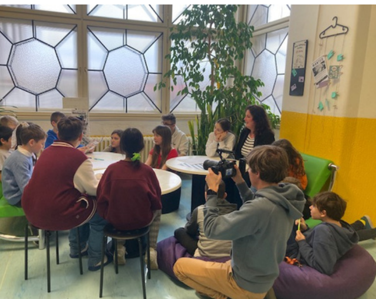
Foto: iKAP II – Inovace, natáčení videa o žákovských parlamentech, ZŠ U Vršovického nádraží, spolupráce s CEDU.