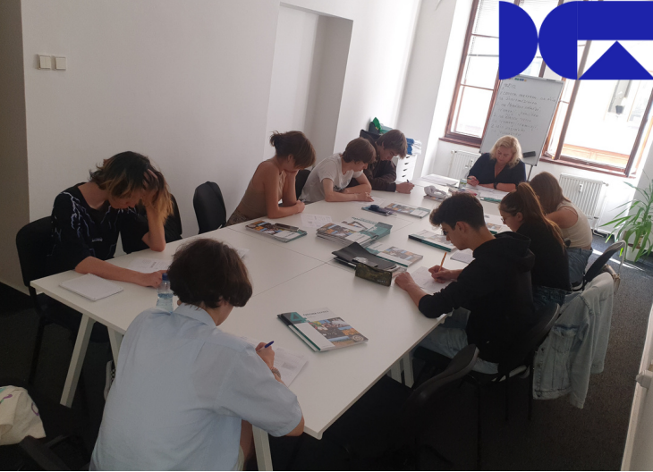
Foto: iKAP II – Inovace, kurz českého jazyka pro ukrajinské děti v Pii.