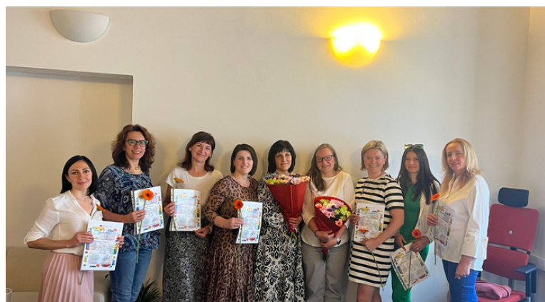
Kurz pro asistentky pedagoga.