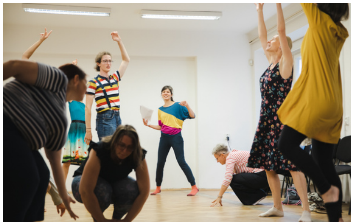
workshop Rytmus do školy patří.

Mentorský program probíhající pod křídly Společnosti pro kreativitu ve vzdělávání přinesl pedagogům mnoho nových nápadů a posílení sebevědomí. Mentorský program pro pedagogy je novým modelem podpory kreativního vzdělávání na školách, jehož funkčnost SPKV v rámci projektu iKAP II – Inovace testovala. V pozici mentorek na pražských základních a středních školách působilo osm umělkyně z různých uměleckých oblastí, které podpořily či nadále podporují necelou dvacítku pedagogů. Program prokázal přínosy spolupráce pedagogů s umělci pro rozvoj kreativní praxe pedagogů, profesně obohatil mentorky a nastínil další možnosti a výzvy pro vývoj a realizaci mentorského programu. Výstupem programu bude metodika s doporučeními (nejen) pro pedagogy a příklady dobré praxe. Materiály budou dostupné na konci roku 2023 na webu spkv.education . Více o dvouletém programu mentoringu se dočtete na webu SPKV zde .